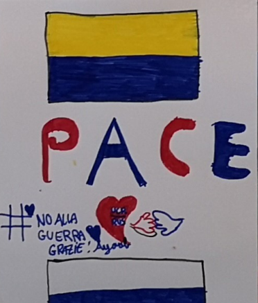
#NO ALLA GUERRA GRAZIE! Luca