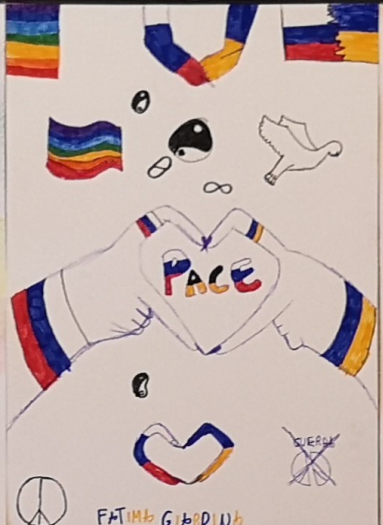
FATIMB G. B. DI UNO